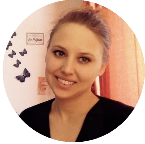
كلاوديا برج هولدا من