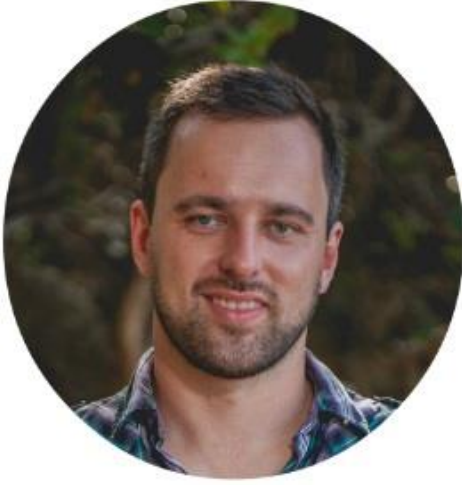
جان ريشتر من

هذا الكتاب الإلكتروني هو عمل مشترك بين EasyDeutsch و كلاوديا من MyGermanAcademy